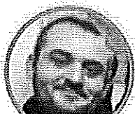
ROBERTO ZOLLO SCUOLA PRIMARIA