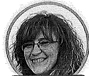
MARIANGELA MAPELLI SCUOLA PRIMARIA