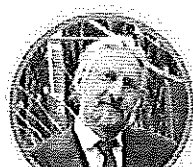
MASSIMO TAVOLA SECONDARIA DI PRIMO GRADO